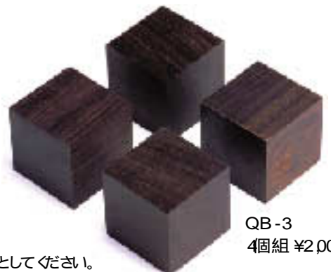
QB-3 4個組 ¥2,000

* QB-1~QB-5のそれぞれの写真はほぼ同じ比率になっています。大きさの目安としてください。