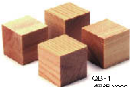
QB-1 4個組 ¥900